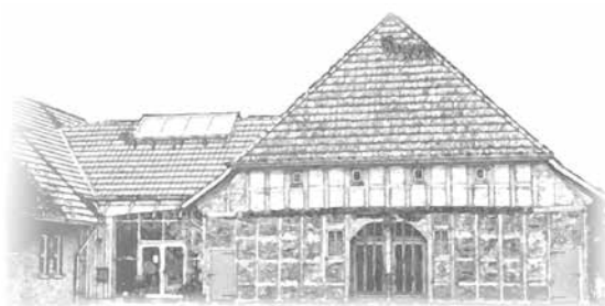
WORTHMANNS HOFF, WAFFENSEN