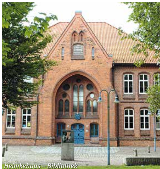
Helmkehaus – Bibliothek

Wenn Sie gerne lesen, stöbern Sie doch in den zahlreichen Medien der Büchereien vor Ort. Diese stellen u. a. auch Bücher in Großdruckschrift oder Hörbücher zur Verfügung. Manche Bibliotheken bieten auch Hilfsmittel