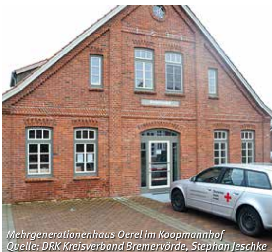
Mehrgenerationenhaus Oerel im Koopmannhof

fältiges offenes Angebot und viele Möglichkeiten, sich ehrenamtlich einzubringen. Zu dem regelmäßigen Angebot gehört z. B. das Tanzen für Senioren.