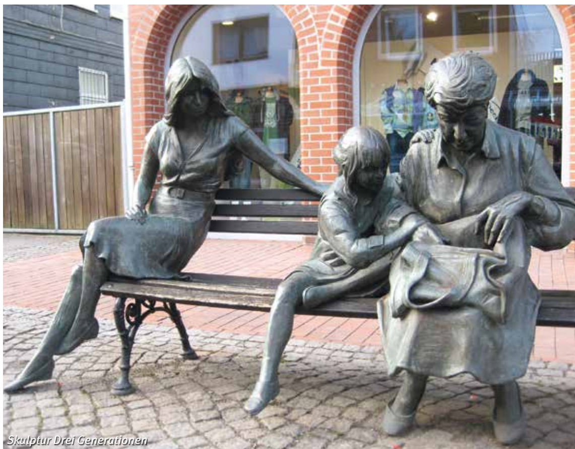
Skulptur Drei Generationen