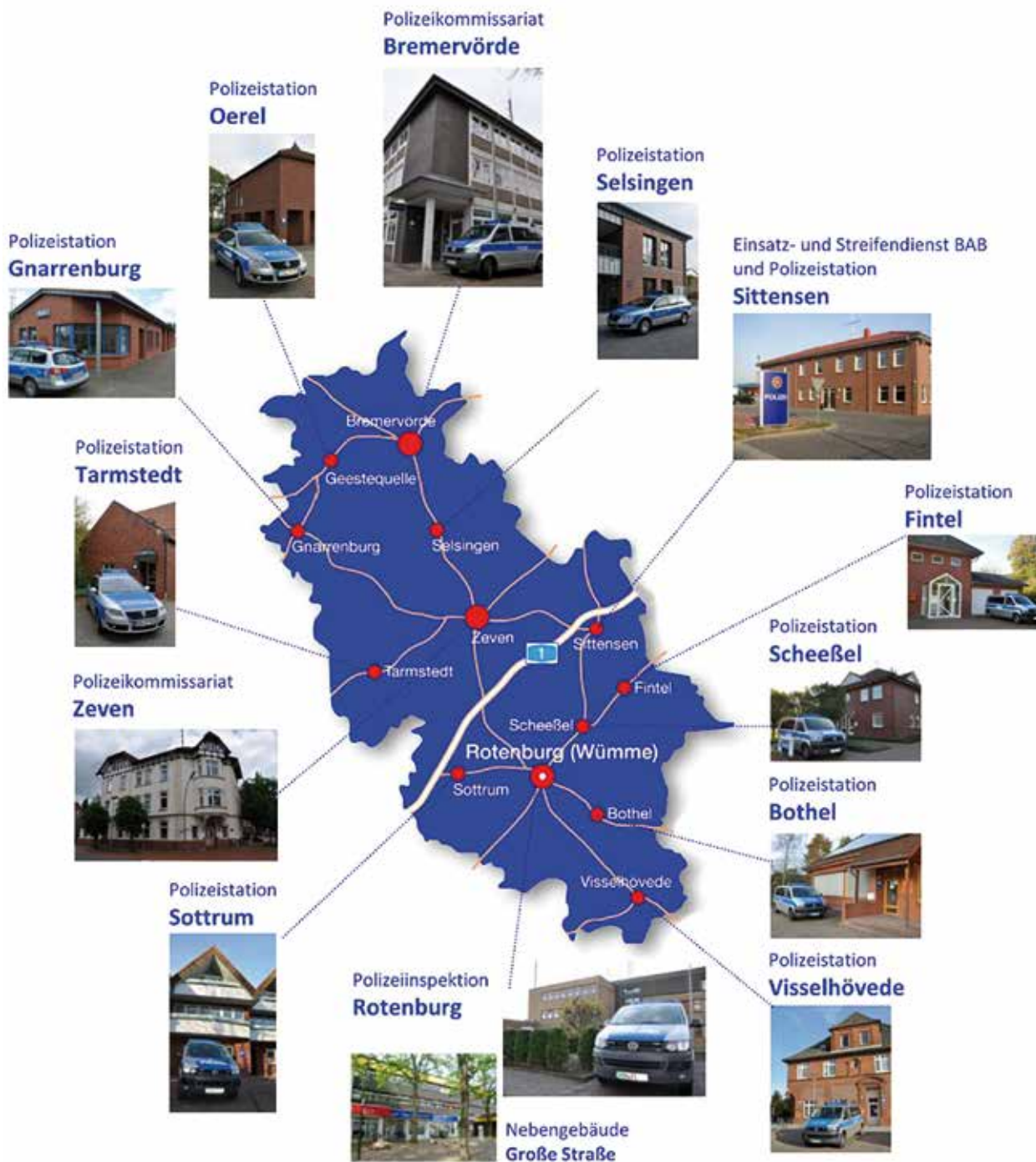
Polizeidienststellen im Landkreis Rotenburg (Wümme)